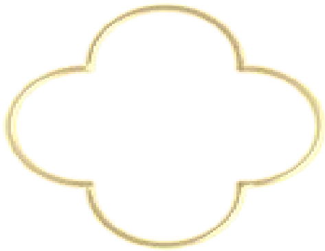
Kristall - An-Anasha - Dankbarkeit

Schmerz, du musst dich erkennen. Und in deiner Selbsterkenntnis, in deiner Meisterschaft in deiner Kraft, liegt auch die Möglichkeit den Schritt zu machen, dass dein Wille sein Wille wird, und damit dein Wille.