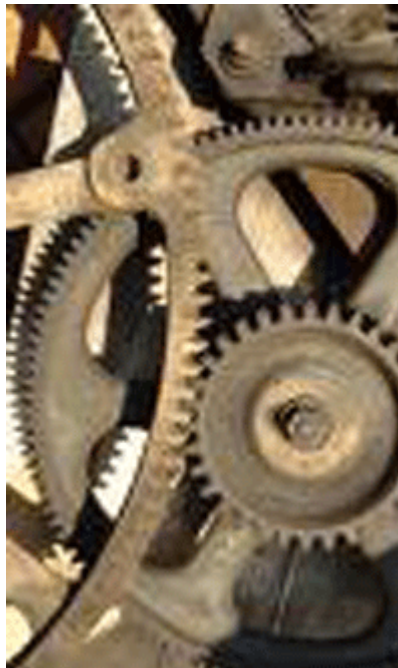
Ratcheting Down Earth's Consciousness

AB: Oh, ja! Vom 20. bis zum 22. März 2013 kam der Erste Schöpfer dieser Galaxie rein und prüfte die Seelenverträge dieser Welt von unten bis oben: Alles, was jemals hier gelebt hat, alles, was jemals hier festgesessen ist – alles aus ihren Seelenverträgen wurde in vollständigem und totem Ausdruck gelesen, sodass es auf eine finale Gleichung dessen herauskam, wo die Erde war, seit sie vom Beginn der Aufstellung des Managementsystems, das wir gerade haben, gereist ist – das Managementsystem ist der Rat der Zwölf; das sind vier Licht, vier Dunkel, vier Neutral. Die Neutrals wurden von den Dunklen rausgeworfen, indem sie sagten: „Wir werden zehn Milliarden Eurer Heimatwelt-Leute töten, wenn Ihr nicht geht.“ Neutrals gingen... Es schrumpfte auf 7 Licht, 5 Dunkel; das heißt, dass das Dunkel mehr seiner niedrigen Bewusstseinswesen hier inkarnieren konnte, was das Bewusstsein der Erde noch mehr runterschaltete, da die Gitterstärke tiefer und tiefer sank, und je mehr niedrige Bewusstseinsleute man in eine Welt mit hohem Bewusstsein bringt, desto mehr muss die Welt den Dimmerschalter anstellen, um sich an sie zu adaptieren – ansonsten könnten solche Bewusstseine nicht hier sein .