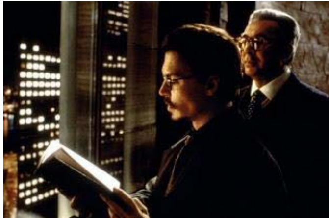
Die neun Pforten – Johnny Depp und Frank Langella