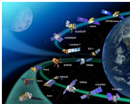
Kleiner Teil „bekannter Satelliten“ und Geräte, die die Erde umkreisen

Die dunklen Jungs hatten dementsprechend über 35/45 Millionen Jahre Zeit, aber die Erdenzeit wechselte, man kann es also nicht gleichsetzen. Sie hatten Zeiten, wo es nicht möglich war, sie zu überfallen, und niemand wusste, wo sie waren. Ihnen war es möglich, massenhaft Truppen inkarnieren zu lassen, sie trainierten diese, „technologisierten“ diese, und dann verwendeten sie die Gebärmutterchakren der Erde, um DNS-Systeme für die Kriegsführung zu erschaffen. Sie breiteten sich dann in einer schnellen Folge aus und erbeuteten Tausende von Planeten und erstellten eine Schicht von Ringen der Herrschaft und Kontrolle – in dessen Zentrum sie die Erde schoben/bewegten/rückten –, und so wie ihre Herrschaft und Kontrolle sich ausdehnt (als ihre Herrschafts-und-Kontroll-Ausdehnung), würden sie die Erde wieder und wieder und wieder bewegen und das Vorwärtsbewegen der Front erhalten.