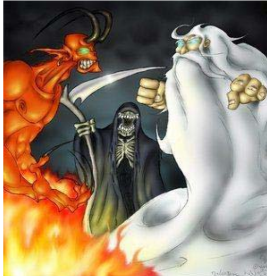
Der Gewinner iiii : Der grauenhafte Sensenmann