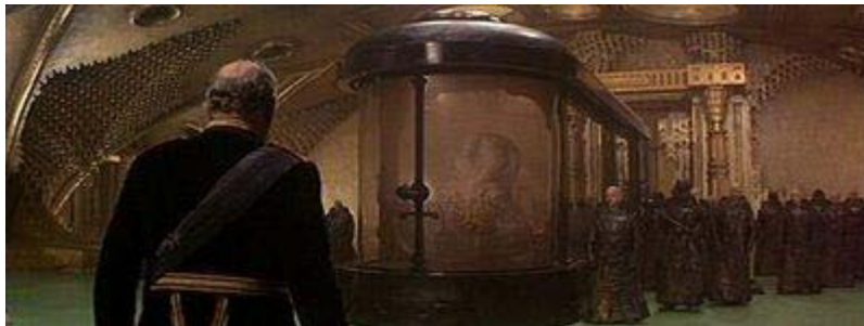
Dune (Spielfilm) – „Zeitreisende Würmer“

AB: Sie waren dort überaus gelangweilt, weil es nichts mehr zu tun gab – als sie von diesem „Kriegs-Ding“ hörten und dachten: „Was ist denn das?“. Also fingen sie an, zu reisen und zu reisen, bis sie an den Punkt kamen, wo all ihre restlichen Teile/Stücke dort hinten wie ein ausgezogenes/ausgefächertes Akkordeon lagen – sie mussten sie ans Licht bringen, das Akkordeon wieder und wieder auseinander ziehen bis endlich ihre kleinen Teilchen sagen: „Meine Güte! Schau dir das an. Schau dir das an... “