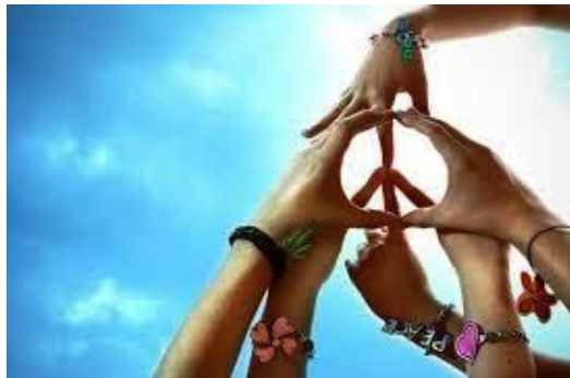
Frieden und Liebe

Seht es als eure Pflicht, euer Glück in Frieden und Liebe anzunehmen und NICHT als Pflicht falschen Fahnen zu folgen, falsche Ehren(tode) zu sterben und falschen „Göttern“ zu dienen. Ihr braucht dies Alles NICHT.