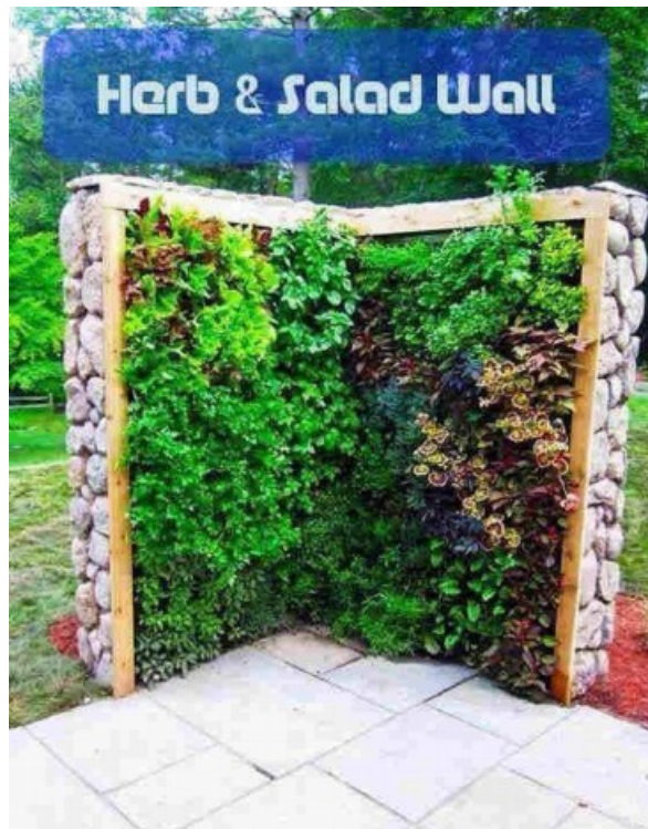
oder als Kräuter - und Salatwand,

obliegt dem Wunsch eines Jeden, je nach seinem individuellen Geschmack. Biologische Abfälle sorgen nach dem Kompostieren, zusammen mit reich an Nährstoffen vorhandener Lava-erde, für ein gesundes Wachstum der Pflanzen.