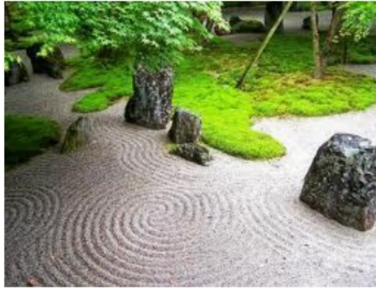
Ob im Stil des japanischen Zen

Passend zur Innenausstattung und der Architektur können die Gärten angelegt sein.