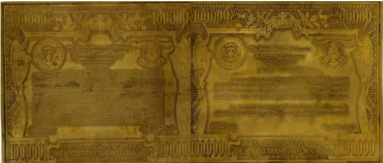
Links der General Bond und rechts die globale Immunität.

Ich hatte diese Dokumente, bereits mehrfach vorgestellt. Der zionitische Rothschild Agent Adolf Hitler, erhielt in weniger als einer Woche, nachdem er sich selbst zum Führer über Deutschland und obersten Feldherrn über die Wehrmacht ernannte, alle notwendigen finanziellen Mittel, um Deutschland für einen langen Krieg vorzubereiten. Einen Krieg welchen er wissentlich niemals gewinnen sollte.