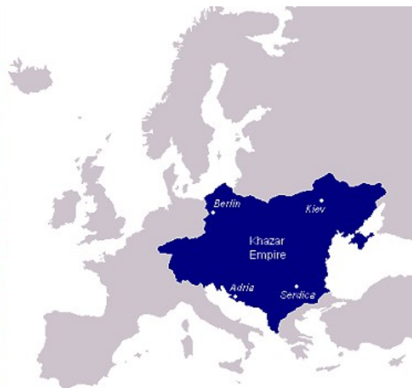
Auf der politischen Karte Links sehen wir den heutigen Grenzverlauf der Ukraine. Rechts daneben die wohl größte Ausdehnung des Khazarischen Reiches

Jeder der die politischen Hintergründe versteht, sollte beginnen, die Politiker aufzufordern Flagge zu bekennen. Es geht keineswegs um eine Bündnistreue zu den USA