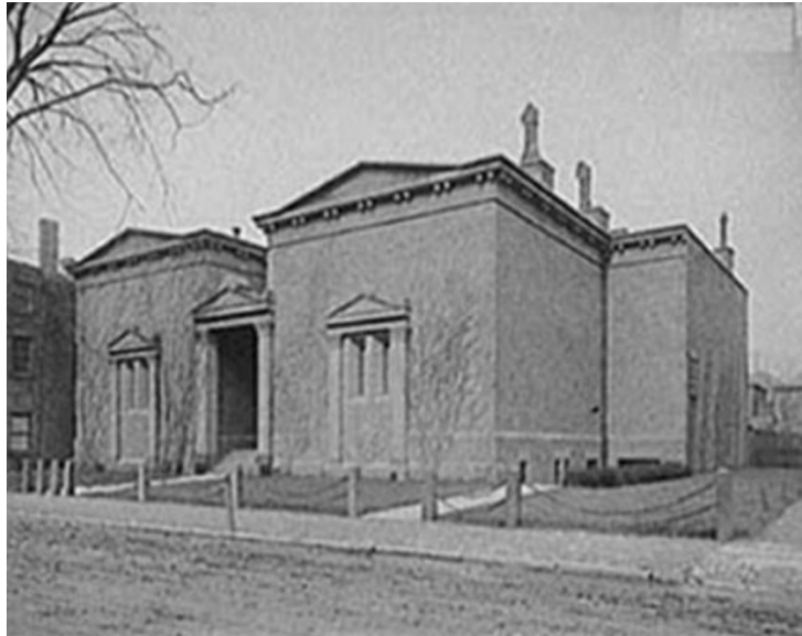
The Tomb, "Die Gruft" der Skull and Bones Geheimgesellschaft. Hier werden jährlich maximal 15 neue Mitglieder aufgenommen.

Hinter verschlossenen Türen, in einem Gebäude, welches "The Tomb" - „Die Gruft“ genannt wird und der satanistischen Skull and Bones Geheimgesellschaft, auf dem Grundstück der Yale Universitaet in New Haven, Conneticut USA gehört, erhielt George W. Bush Sr. Bei seiner Einweihung als Logenmitglied, in einem offenen Sarg liegend den Namen Magog . Sein Vater Herbert Walker Bush hatte bereits diesen Logennamen und es ist anzunehmen, dass George W. Bush Jr. Ebenfalls diesen Logennamen bei seiner Einweihung angenommen hat.