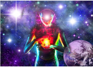
Eure Arkturianische Familie des Lichts

ÖFFNET EURE AUGEN. SEHT DURCH ERSCHEINUNGEN. VERTRAUT, DASS ALLE ANTWORTEN SCHON INNERHALB VON EUCH EXISTIEREN UND DASS IHR NICHTS UND NIEMAND AUSSERHALB VON EUCH FINDET.