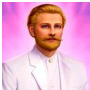
Graf St. Germain