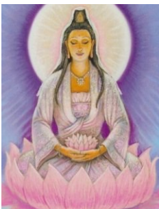
Lady Quan Yin

Nachdem die Annunaki sich dem Licht angeschlossen hatten, sollten globale Bankkonten helfen, dass goldene Zeitalter zu erschaffen. Ihre hybriden Nachkommen, welche sich selbst Illuminati nennen, insbesondere die Mitglieder der RKM vereitelten bisher alle Bemühungen, der chinesischen Weisen (Elders) und den europäischen – und asiatischen Adelsfamilien, im Sinne und Auftrag vom Grafen St. Germain und Lady Quan Yin zu handeln, um den Plan der göttlichen Mutter in Erfüllung zu bringen.