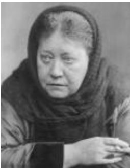
Helen Petrova Blavatsky 1875 Begründerin der Theosophischen Gesellschaft :