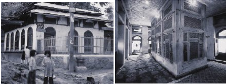
Mitten in Srinagar, der Hauptstadt Kaschmirs, befindet sich das Grab von Yuz Asaf, wie man Jesus in Indien meistens nannte. Aller Wahrscheinlichkeit nach liegen die sterblichen Überreste von Jesus in diesem hölzernen Schrein im Innern der Grabstätte.

Jesus soll der Überlieferung nach noch lange Jahrzehnte in Kaschmir gelebt haben und erst in höherem Alter verstorben sein. Wie schon erwähnt, war Maria Magdalena seine Frau, und hatten sie auch mehrere Kinder. Das mag besonders bibeltreue Leser empören – doch was sollte am Kinderhaben ungöttlich, ja, gar schlecht sein? Ist es nicht ein natürlicher Teil eines menschlichen Lebens? Und wenn Jesus dieses menschliche Leben nicht hätte bis zur Neige leben wollen – dann hätte er das Kreuz eben nicht überlebt! An seiner Lehrtätigkeit hinderte ihn sein ‚normales‘ Leben bestimmt nicht. Zudem brachte er die Qualität der Nächstenliebe und des Mitgefühls zu den Menschen, und diese Qualitäten lassen sich vortrefflich in einer Familie (vor-)leben. Und wie starb Jesus dann, wenn er nicht in Bethanien in den Himmel auffuhr?