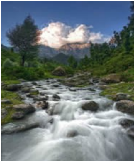
Kaschmir – Das Land wo Milch und Honig fließt.

Die kleine Verschiebung eines Wortes innerhalb eines Satzes bringt eine völlig andere Bedeutung hervor. Jesus sagte ganz gewiß nicht, daß jener Schächer ‚heute‘ mit ihm im Paradiese sein werde – denn er hatte noch nicht vor, ins himmlische Paradies einzugehen. Statt dessen führte ihn sein Weg über Damaskus der alten Seidenstraße entlang in ein irdisches Paradies, ins Land, wo Milch und Honig flossen – schon zu Mose‘ Zeiten: Nach Kaschmir.