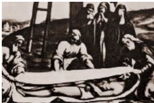
Eine Rekonstruktion, wie Jesus in das Linnen gelegt wurde. Der Rücken lag auf der einen Hälfte, und die andere Hälfte wurde über das Haupt geschlagen. Deshalb konnte sich sein Körper wie auf photographische Trockenplatte auf das Linnen prägen.

Seit 1865 war es Tradition geworden, das heilige Grabtuch Jesu alle 33 Jahre den Gläubigen zu zeigen. Bis zum Tode Umbertos im Jahre 1984 gehörte es der savoyardischen Königsfamilie und wurde in Turin aufbewahrt. (Daher die Bezeichnung ‚Turiner Grabtuch‘). Kurz vor Umbertos Tod besuchte Papst Johannes Paul II. ihn in seinem Lissabonner Exil und erreichte, dass der Ex-König Italiens das ‚heilige Linnen‘ dem Vatikan vermachte. Drei Päpste, nämlich Leo XIII., Pius X. und Pius XI. hatten öffentlich bekundet, dass ihrer Meinung nach das Grabtuch authentisch ist. Auch Papst Pius XII. anerkannte die Echtheit des Tuches. Anlässlich des Eucharistischen Kongresses Italiens erwähnte er im September 1953 in Turin den „kostbaren Schatz des heiligen Grabtuches“, „an dem wir, ergriffen und trosterfüllt, das Abbild des entseelten Leichnams und des leiderfüllten göttlichen Antlitzes Jesu verehren.“