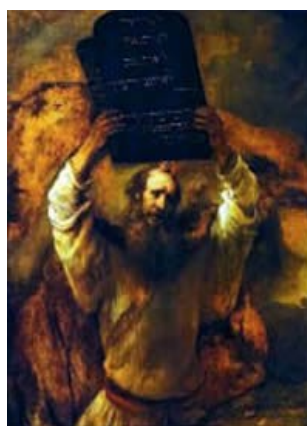
Moses starb in Kaschmir. Sein Grab, 70 Kilometer nördlich von Srinagar, wird noch heute von Rishiss behütet und bewacht.

Gemäß biblischer Überlieferung blieben die Israeliten hier elf Monate. Dann versuchten sie, in das Gelobte Land weiterzuziehen, doch schlug dieses Unternehmen fehl, und das Volk Israel zog nach vierzig Jahren (‚vierzig‘ ist eine mystische, keine für real zu nehmende Zahl, die einfach ‚eine lange Zeit‘ bedeutet) in der Wüste umher.