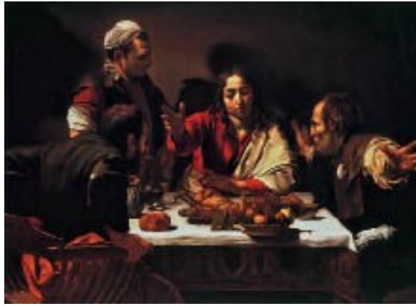
Der „Auferstandene“ Jesus spricht und isst(!) mit zwei Jüngern in Emmaus und betont er sei aus „Fleisch und Bein“ Folglich kann sein Körper nicht gestorben sein (Gemälde von Caravaggio).