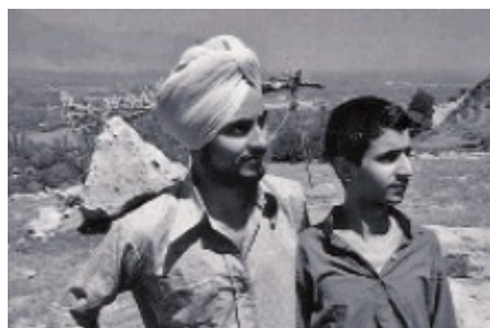
Im Profil dieser beiden Männer erkennt man deutlich den Unterschied zwischen den nordindischen Rassen: semitische Abstammung, von den Ansässigen ‚Söhne Israels‘ genannt (rechts), und die indoiranische Abstammung (links).

Jesus stellte für das damalige Judentum eine Bedrohung dar, da er einen liebenden Gott predigte, statt einen Gott, den man fürchten muß. Wiederholt wandte er sich gegen die starren Gesetze des Judentums – und machte sich damit gemäß den Gesetzen der Thora zum ‚Gottesverächter‘, den zu verfolgen das Gesetz befahl. Er befand sich also in der schwierigen Lage, mit jeglicher neuen Lehre gegen die alten Gesetze zu verstoßen – und damit ein ‚Verbrechen‘ zu begehen, das nur mit dem Tod gesühnt werden konnte.