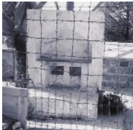
Das Grab von Mutter Maria in Mari, Pakistan, wird seit Menschengedenken von der Bevölkerung verehrt.