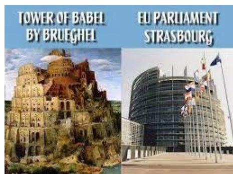
Turm von Babel/Eu Parlament

Althochdeutsch gilt als die Sprache, welche mit dem „Phönizischen“, als Sprache am nächsten verwandt ist.