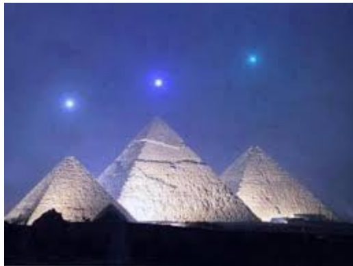
Siriuskonstellation über den Gizeh Pyramiden

Es gibt im Internet reichlich Informationen über die Siriusverbindung zu unserer Erde und damit zu uns. Die Pyramiden von Gizeh in Ägypten wurden auf das im Sternbild des Löwen befindlichen Siriussystem ausgerichtet.