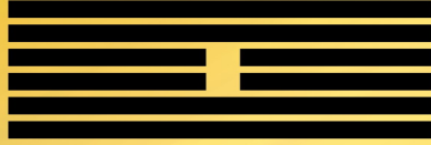
Hexagramm 61 »DSCHUNG FU« Die innere Wahrheit (Die Einsicht)