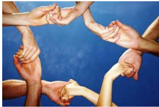
MENSCHLICHKEIT unsere Zukunft

Große Blöcke zerfallen, Staatenbünde lösen sich und Länder spalten sich zum Missfallen der Globallisten auf. Eine neue Ordnung in der Welt entsteht. Die Neue Weltordnung NWO ist dem Untergang geweiht.