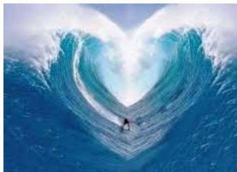
Flutwelle der Liebe (TSUNAMI)

https://www.youtube.com/watch?v=m8e87xJt8fM