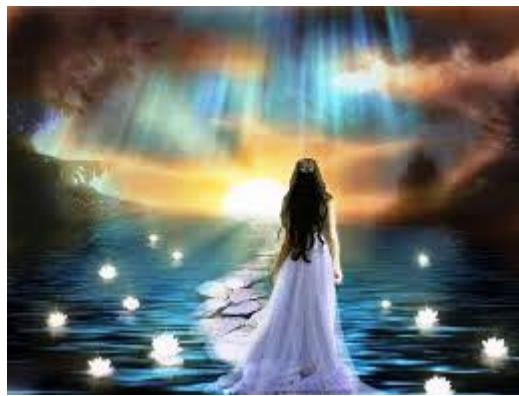
Ein neuer Tag kann beginnen

Eine notwendige kritische Masse spiritueller menschlicher Liebesenergie, wurde durch das SEIN und TUN Vieler, die Anomalie der künstlichen Matrix zu beenden, willkommen geheißen. Diese selbstlosen Menschen repräsentieren den freien Willen der Menschheit nach Selbstermächtigung, der Rückkehr zum Einheitsbewusstsein und der Inbesitznahme unseres göttlichen Geburtsrechts.