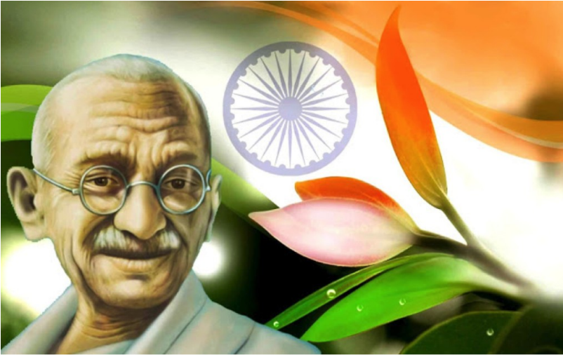
Mahatma Gandhi, einer der beliebtesten Helden der Welt