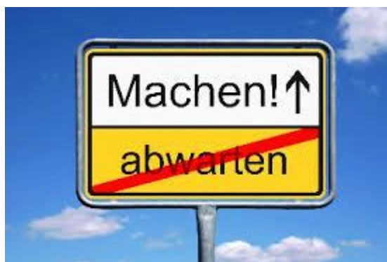
Machen! oder abwarten

Aus dem Potential (Zukunft) die richtigen Entscheidungen treffen.