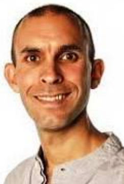
Professor Anil K. Seth

Immer wieder hatte ich über die Tatsache diskutiert, dass Jeder von uns das ganze Universum, um sich herum in jeder Sekunde neu manifestiert. Der britische Neurowissenschaftler Anil K. Seth, Professor für Kognitive und Computational Neurowissenschaft an der Universität von Sussex erbringt in seinem Video, den unwiderlegbaren Beweis, dass unsere „Realität“ nicht durch die Welt, welche uns umgibt geformt wird. Tatsache ist das Gegenteil, unser Gehirn halluziniert unsere „Realität“ ins DaSEIN!