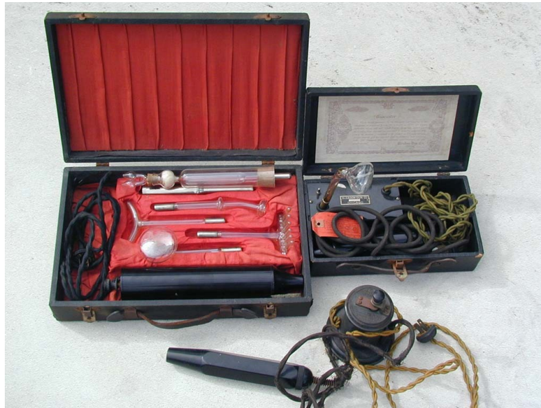
Ein altes Gerät.

wurden die Anomalien oft innerhalb weniger Wochen entfernt. Der violette Strahl nahm oft Schmerzen, und oft ist es fast ein Wunder.