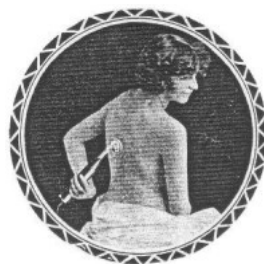
VITALITY - PHYSICAL DEVELOPMENT

Die technische Wirkungsweise lässt sich unter anderem hier nachlesen: j-lorber.de/hf-licht-ozon/hf-wirkung-technisch.Hochfrequenz-Strahl - http://www.j-lorber.de/heilig/elektr/hf-licht-ozon/hf-wirkung-technisch.htm#Was%20sind%20Hochfrequenz-Strahlgeraete?