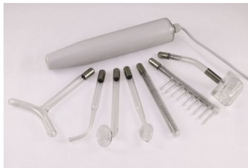
Ein modernes Gerät. „Profi Hochfrequenzgerät“

Die technische Wirkungsweise lässt sich unter anderem hier nachlesen: j-lorber.de/hf-licht-ozon/hf-wirkung-technisch.Hochfrequenz-Strahl - http://www.j-lorber.de/heilig/elektr/hf-licht-ozon/hf-wirkung-technisch.htm#Was%20sind%20Hochfrequenz-Strahlgeraete?