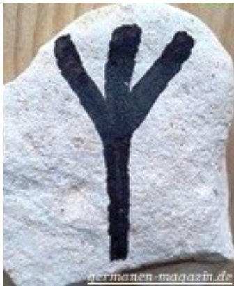
Algiz-Rune – Germanisches – Friedenssymbol

Es war ein langer Weg den wir gehen mussten, bis Weltfrieden möglich wurde.