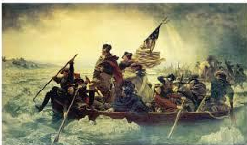
Washington überquert den vereisten Delaware

US Verteidigungsminister General Mattis bestätigte die Echtheit von Q-Anon als wahre Informationsquelle, indem er exakt das Gemälde, des deutsch – amerikanischen Malers Emanuel Leutze von 1851, in dem General Washington den vereisten Delaware überquert zu Weihnachten veröffentlichte, welches zuvor Q-Anon veröffentlicht hatte.