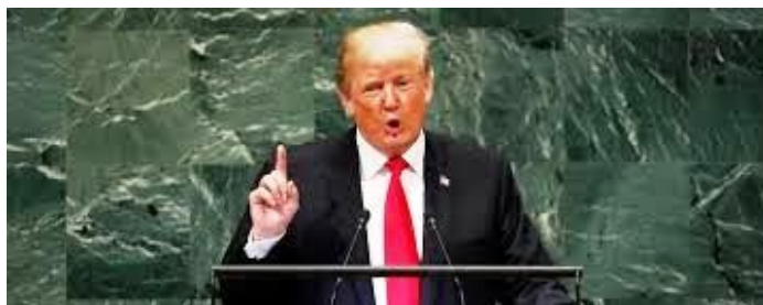
Trump vor der UN am 25. 09. 2018

https://www.youtube.com/watch?v=4KIpnPapquY