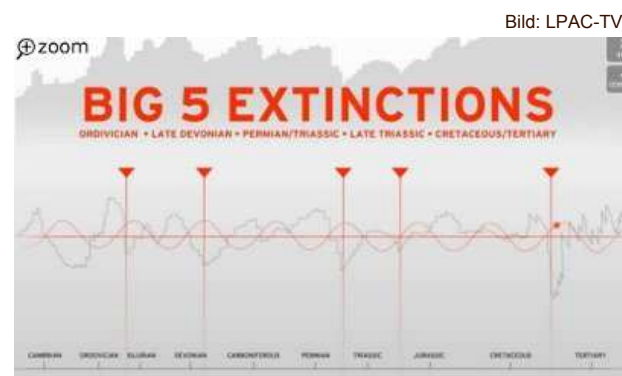
Abb. 1: Die fünf „großen Extinktionen“, bei denen jeweils mehr als 50% aller Gattungen ausstarben, traten in einem Zyklus von ca. 62 Mio. Jahren ein - jeweils dann, wie auch momentan wieder, wenn die Erde im Verlauf ihrer auf- und abwärts schwingenden Bewegung die Ebene der Galaxis überschritten

Jene, die sich in der biologischen und geologischen Geschichte unseres Planeten gut auskennen, werden einwenden: „Sie stellen hier einfache Korrelationen her, wodurch galaktische Zyklen und kosmische Strahlung mit